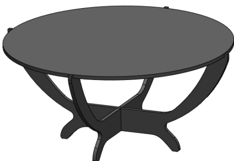
The final plexi top should be like photo

Note : Before mounted item, take of PVC from plexi