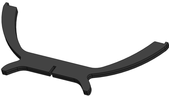
Two pieces of leg