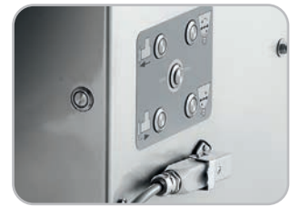
Sistema comandi Full Control (per Format S/SX) Full Control system (for Format S/SX)