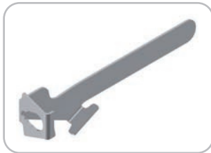
Leva avvita/svita ghiera TC 32 standard Standard TC 32 ring fixing/removing tool