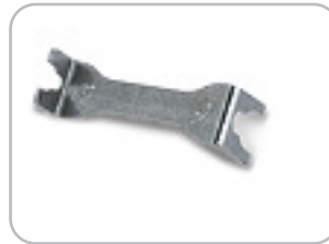
Estrattore piastre Plates removal tool