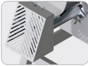
Opzionale: sistema di protezione interbloccato per uso piastre con foro > 8 mm

Optional: interlock protection for more than 8 mm holes plates.