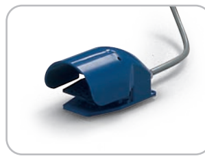
Pedaliera opzionale Optional pedal controls