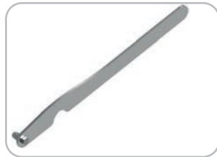
Leva avvita/svita ghiera TC 42 standard Standard TC42 ring fixing/removing tool